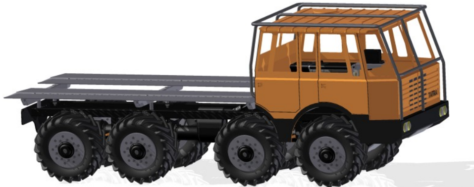
Obr. 1: Celkový pohled

Pro tuto práci si autor vybral vytvoření 3D modelu Tetry T813 KOLOS pro RC truck trial v měřítku 1:10. Autor pro svůj model uzpůsobil koncepci nosné roury u nákladních automobilů Tatra.