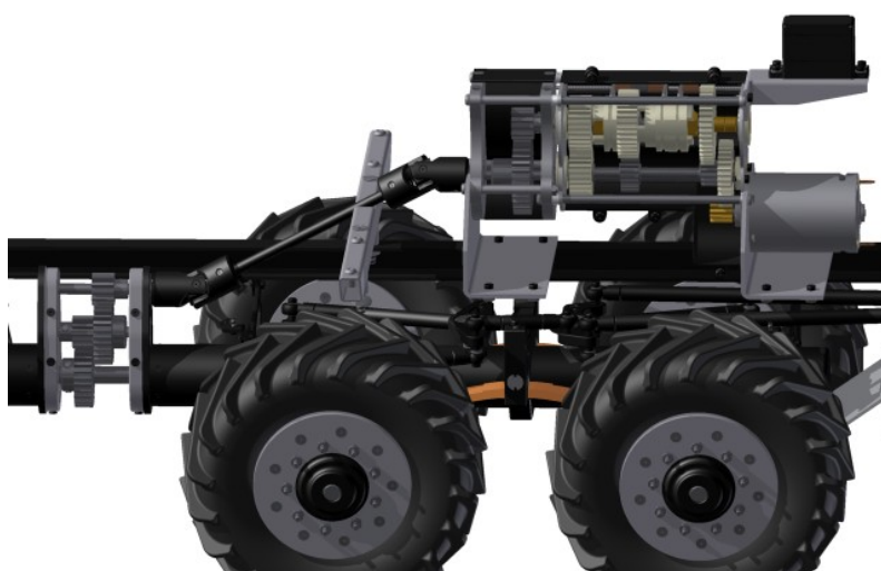
Obr. 3: Znáznornění převodovek