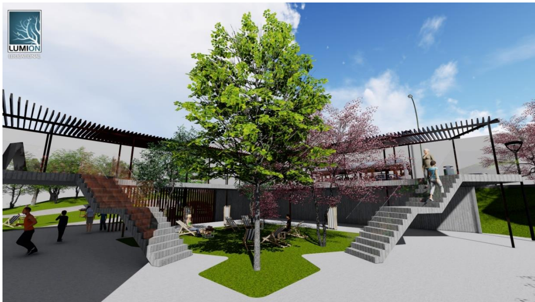
Obrázek č.8 – Pohled na atrium

Navazuje na přístavbu a zasahuje až na okraj pozemku k pozemní komunikaci. Půdorysem připomíná tvar písmene „L“ a jeho účelem je propojovat hlavní budovu s přístupem. Naskýtá možnost dostupnosti „suchou nohou“ a tím pádem i bezbariérový přístup na jedné úrovni v druhém nadzemním podlaží.