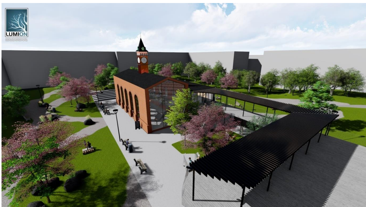
Obrázek č.1 – Vizualizace areálu ze směru pozemní komunikace

Studie Společensko – Kulturní centrum Koželužna se snaží o architektonickou úpravu stávajícího objektu a jejího okolí. Má jít o přeměnu na odpočinkové a volnočasové centrum, kde by návštěvníci z městské části Kukleny a především obyvatelé plánovaného domu pro seniory našli klid a pohodu. Zároveň by areál měl naskýtat možnosti pro konání společenských událostí. Koncertů, výstav a trhů.