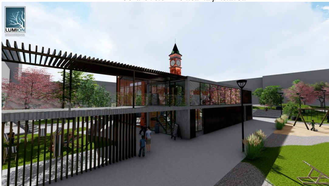
Obrázek č.7 – Pohled na přístavbu od pozemní komunikac