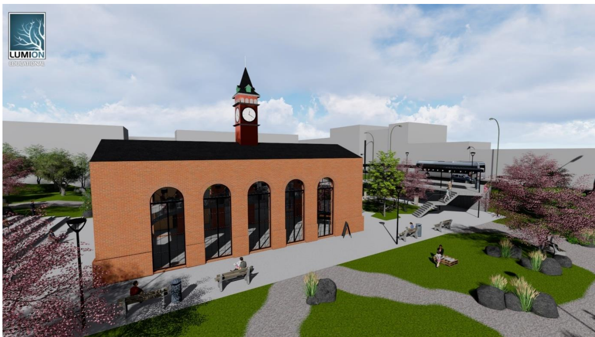
Obrázek č.10 – Pohled na stávající objekt a atrium z východní strany areálu

Vše jsem projektoval tak, aby disponovalo co největší estetičností, ale i funkčností a trvanlivostí. Celá studie je řešena především tak, aby přitáhla široké generační spektrum obyvatel. Tudíž pomohla společenskému soužití.