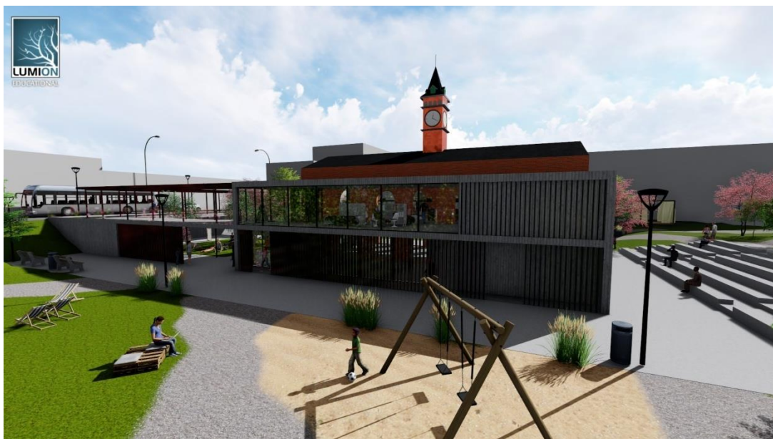
Obrázek č.6 – Pohled na přístavbu

Poněvadž byly vzneseny požadavky na prostor, který by obsahoval všechny výše uvedené objekty, bylo by téměř nemožné, vše vměstnat do stávajícího objektu, aniž by nezanikla možnost velkorysého prostoru, jež by umožňoval pořádání výstav a v něm plynulý a bezproblémový pohyb návštěvníků. Tím pádem vznikla druhá dvoupodlažní budova, která obsahuje toalety v obou podlažích, místo pro výtah a kavárnu s posluchárnou, která je rozšířena o galerii zasahující do hlavní budovy. Zpřístupněna je dvoupodlažním atriem tvaru „L“ které nabízí další možnosti, jež nastíním v dalších odstavcích. Navíc je situována tak, že obsahuje hned několik vstupů, což umožňuje snadný přístup ze všech směrů a oblastí areálu. Uvnitř budovy je schodiště přímo v přístavbě kolem jádra výtahu a druhé z galerii už v hlavní budově. Budova je dilatována ocelovými pásky, aby byl vidět kontrast mezi novým a starým, ale ne přespříliš.