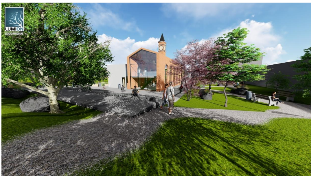
Obrázek č.9 – Pohled ze zadní části areálu

Za hlavní budovou a přístavbu, tedy na východní straně objektu je pětiřadý stupňovaný amfiteátr, který má poměrně jasný účel. Letní kino, přičemž není potřeba plátna a na velice hladký pohledový beton lze promítat filmové materiály. Dalším využitím může být opět hudební vystoupení, či ochotnické divadlo, nebo přednáška pod širým nebem. Co se stromů týče, byly vybrány původem exotické, avšak u nás běžně vysazované listnaté stromy středního vzrůstu. Tedy mezi 5 – 9 metry výšky. Především se jedná o Japonský javor a odnože Sakury.