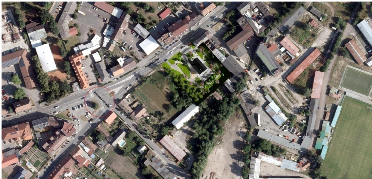
Obrázek č.2 – Orto fotografie situace se studií

Po vybourání areálu zbyla pouze centrálně umístěná budova s hodinovou věží. Nachází se u tepny Kuklen, tedy pozemní komunikace, Pražská třída. Tato kritéria mají své výhody a naopak. Dostupnost je vynikající, avšak soukromí by areál do budoucna už tolik nabízet nemusel. Stejně tak je tomu i s mírou hluku a znečištění ovzduší plyny, produkovanými automobily od blízké pozemní komunikace.