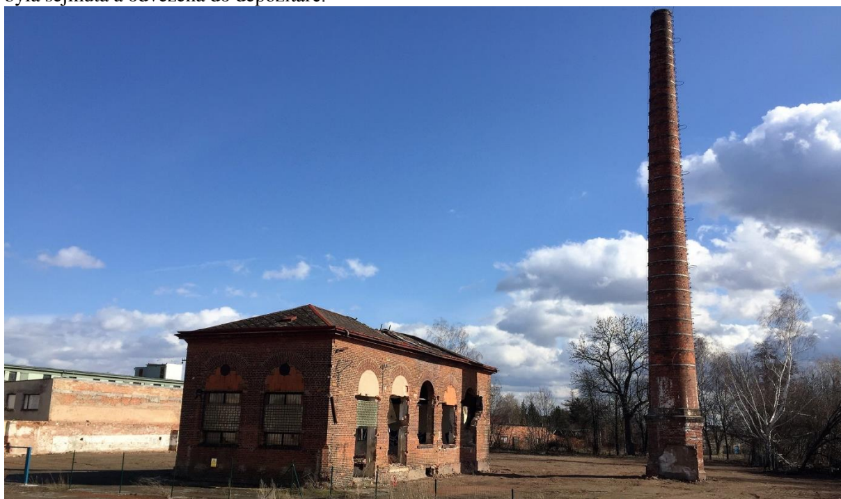
Obrázek č.3 – Současný stav objektu

V současné době je areál nepoužíván a stávající objekt chátrá a čeká na svou revitalizaci. Okolí budovy je nyní uklizené a pozemek je oplocen, tím pádem znepřístupněn. Do nedávna nacházel útočiště bezdomovců a jiných existencí, navíc byla podstatná část konstrukce zdevastována zloději a vandaly. Celá budova je tím pádem v havarijním stavu, přičemž krytina se propadá dovnitř a výztuže stropní konstrukce jsou kompletně zkorodované. Zachráněna byla pouze věžička s hodinami, která byla sejmuta a odvezena do depozitáře.