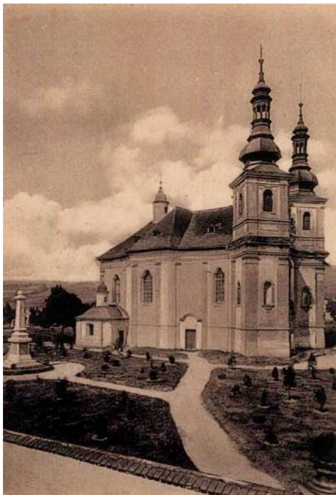
Obr. 12 Historická podoba kostela Panny Marie

Kostel byl renovován roku 1825 a poté ještě jednou roku 1967. Poblíž tohoto kostela při hřbitovní zdi se nachází kaple sloužící jako márnice. V ohradní zdi je portál se sochami andělů a s vázami antického stylu z roku 1760. V současné době kostel stále plní svou funkci a je jednou z hlavních dominant Klášterce nad Ohří.