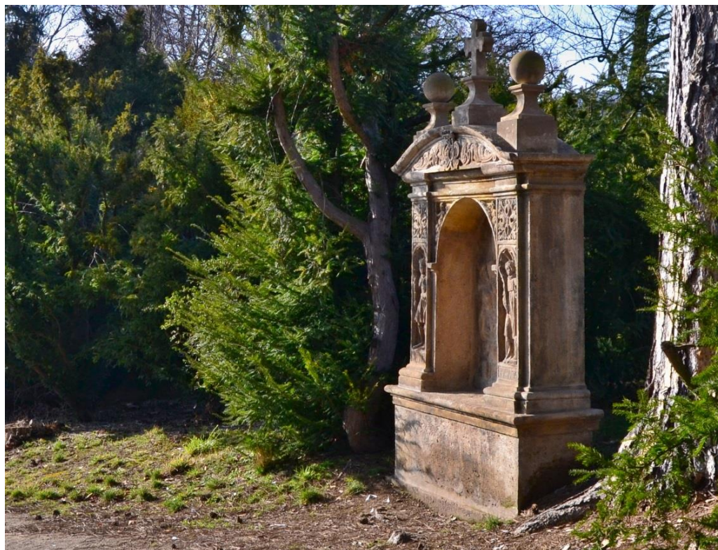
Obr. 8 Fotografie jedné ze sedmi bolestí Panny Marie (Část Stibalova okruhu)