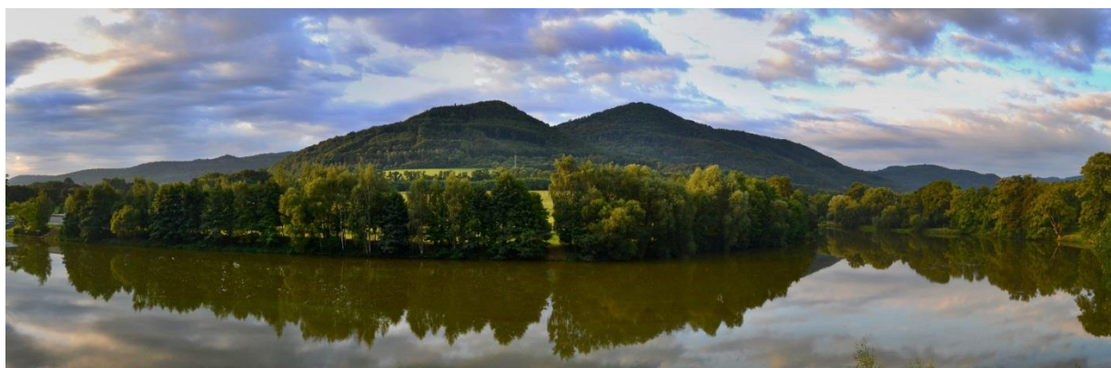
Obr. 5 Panoramatický záběr na okolí zámeckého parku v Klášterci nad Ohří

Klášterecký park není sice rozlohově příliš rozsáhlý, ale pro lepší orientaci byly vytyčeny tři naučné dendrologické okruhy západní, zámecký a Stibalův. Tyto okruhy mají návštěvníkům nejen poskytnout lepší orientaci v parku, ale hlavně si zde každý rozšíří své znalosti z oboru botaniky a dendrologie.