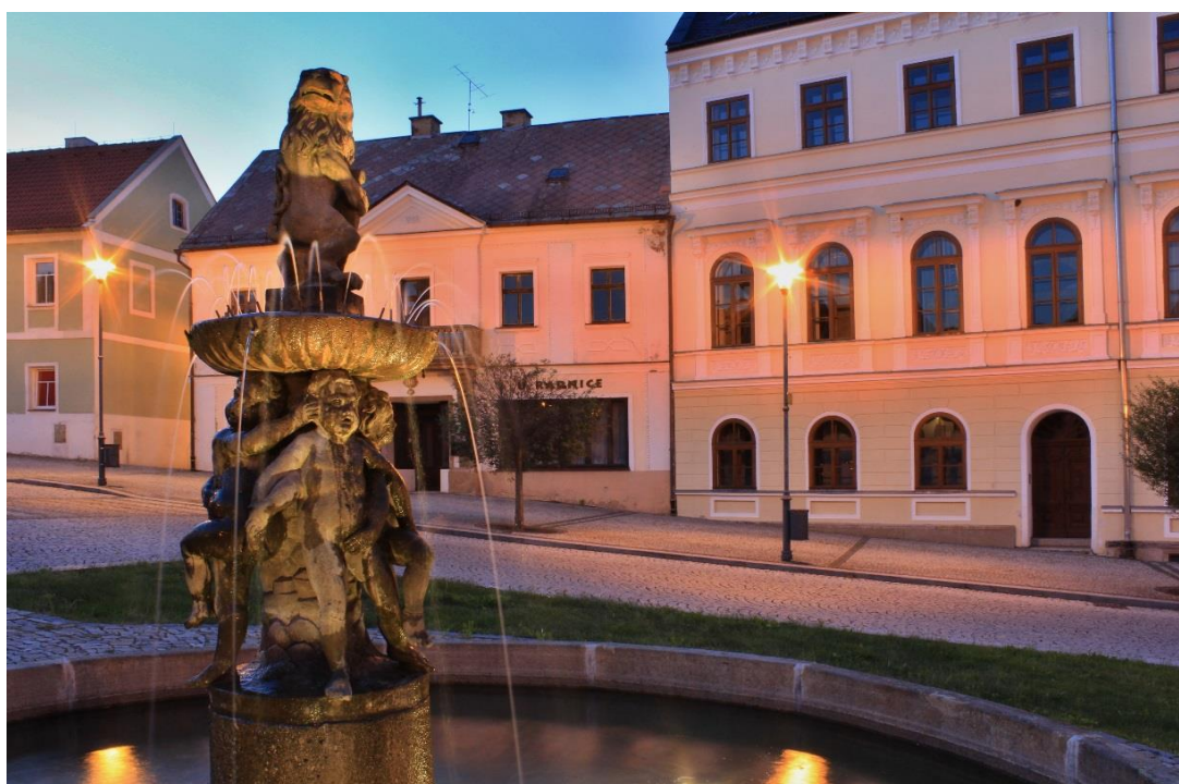
Obr. 14 Historická kašna na náměstí v Klášterci nad Ohří

Nyní se v našem vyprávění ocitáme v samotném srdci města, a to na náměstí, které sice nepatří zdaleka mezi největší, ale za to na něm najdeme mnoho zajímavých turistických a pamětihodných zajímavostí. Pojdme se po pár takovýchto objektech podívat. Pozornost si podle mého názoru zaslouží i obytné domy na náměstí i v přilehlých ulicích, i když nejsou všechny zapsány na seznamu památek. Po několika požárech, které město postihly, sice ztratily svůj původní historický architektonický ráz, přesto však zachovávají původní charakter náměstí i přilehlých oblastí. S výjimkou radnice výška domů nepřesahuje více jak 2. patra.