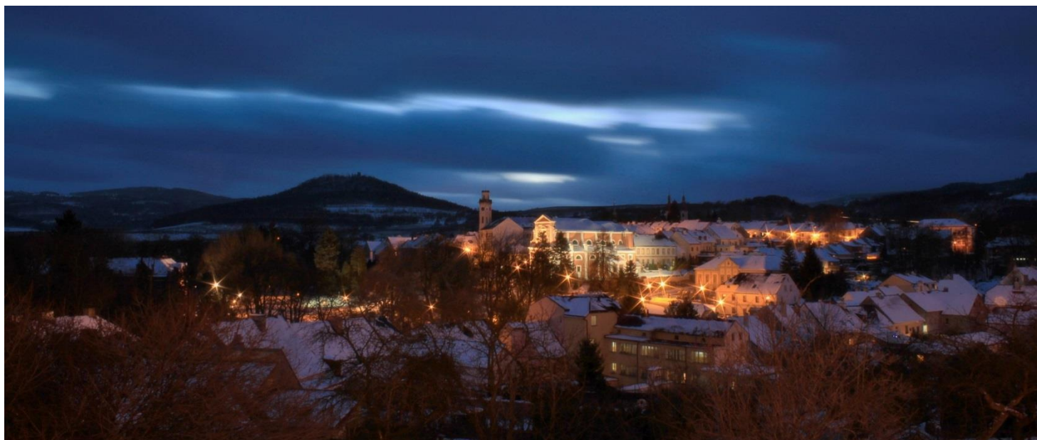
Obr. 1 Noční pohled na město Klášterec nad Ohří

Město Klášterec nad Ohří ležící na levém břehu řeky Ohře je město s velmi zajímavou a bohatou historií. Nachází se na místě, kde krásnou přírodní kulisu tvoří rozhraní Krušných a Doupovských hor. Hlavní dominantou tohoto města je památková zóna v první řadě s novogotickým zámekem a rozlehlým zámeckým parkem skýtající nespočetný sortiment cizokrajných dřevin. Turisté zde mohou ocenit kromě památek také lázeňský areál Evženie, a nebo blízkost přírody a odpočinku.