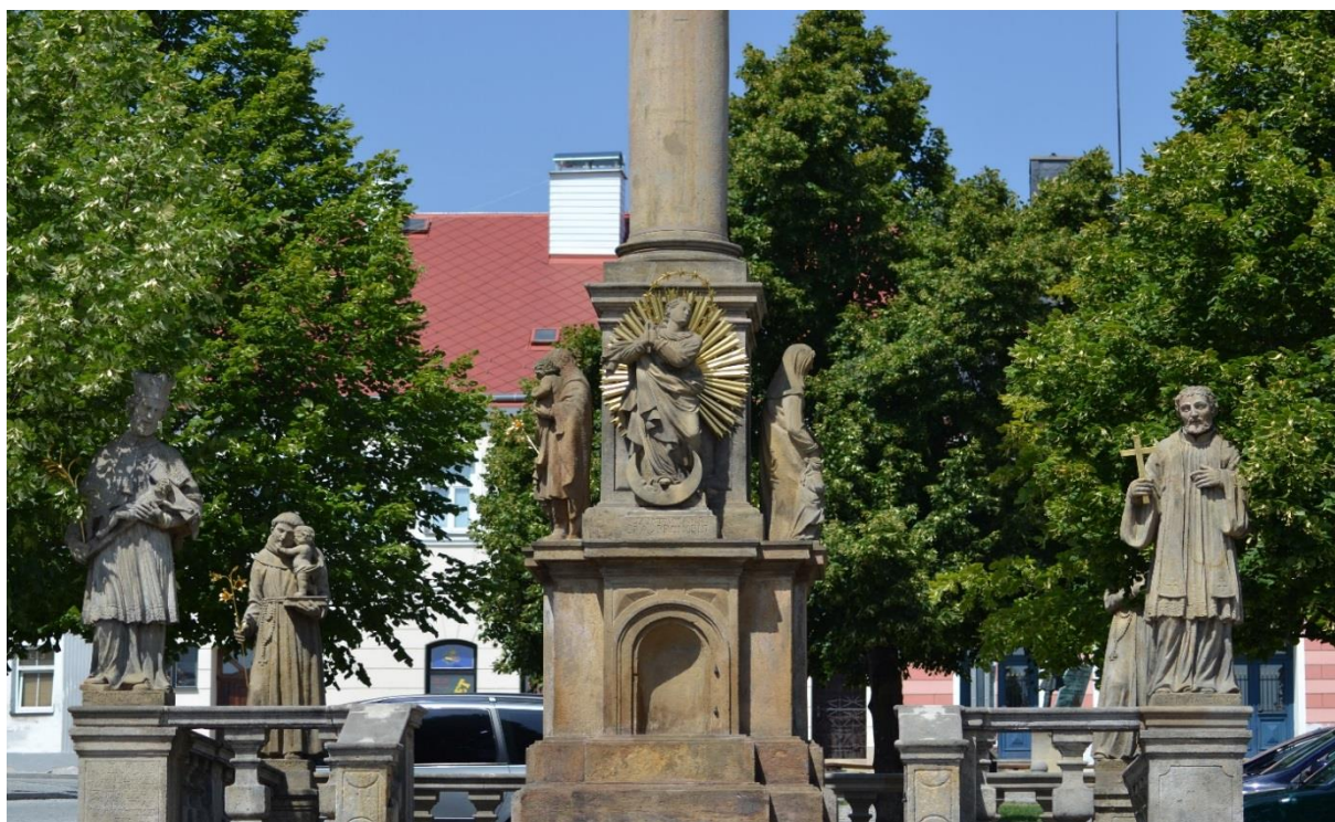
Obr. 16 Sloup Nejsvětější Trojice na náměstí

Od radnice přecházíme do horní části náměstí, kde nacházíme Sloup Nejsvětější trojice. Na náměstí byl vztyčen kolem 17. století. Často se zde nabízí chyba, že se jedná o morový sloup, ale nenechte se zmást. Tento sloup není připomínkou žádné morové epidemie, naopak byl z darů věřících křesťanů vytvořen jako poděkování, že se mor Klášterci vyhnul, zatímco jinde v Čechách zabíjel tisíce lidí. V minulosti však tento sloup nebyl jedinou dominantou na náměstí, ale nacházela se zde také historická kašna olemovaná sochami Jana Brokofa, které po jejím zrušení byly přemístěny právě do prostoru zámeckého parku před Sala terrenu. V současné době na místě bývalé historické kašny stojí socha rytíře. V pozdějších letech byl sloup olemován sochařskou výzdobou na podstavci i na samotné balustrádě sloupu.