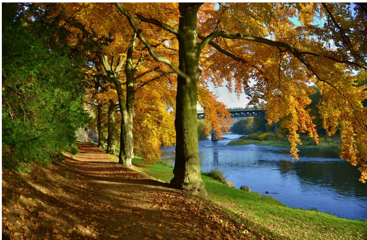
Obr. 7 Záběr zachycující část Stibalova prohlídkového okruhu v zámeckém parku

V parku mohou návštěvníci spatřit velmi vzácné druhy dřevin jako například: šácholan zašpičatělý, pamodřín Kaempferův nebo bříza Maximovičova (cca 220 druhů dřevin z celého světa).