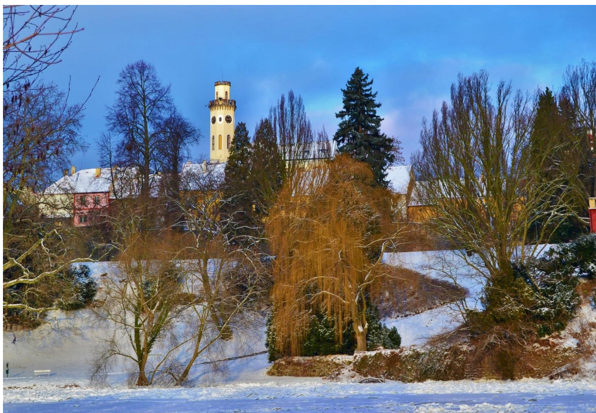
Obr. 6 Zimní park v Klášterci nad Ohří