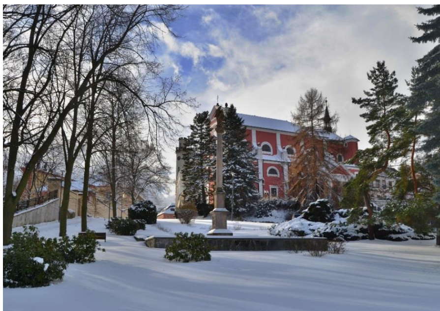
Obr. 11 Historické centrum města Klášterec nad Ohří