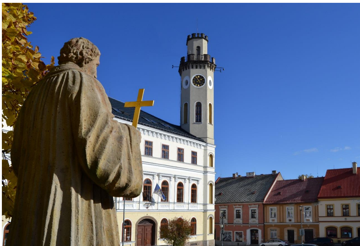
Obr. 15 Radnice v historickém centru města

Nyní Vás zavedu do samotného středu města, a to na náměstí Edvarda Beneše kde najdeme několik pozoruhodných zajímavostí. Jako první se zaměříme na historickou radnici města. Radnice byla postavená podle plánů stavitele Böhma z Mostu v letech 1855-60, přístavby směrem do dvora radnice jsou z pozdější doby. Jedná se o pseudorenesanční nárožní budovu a polygonální nárožní věž zakončenou cimbuřím.