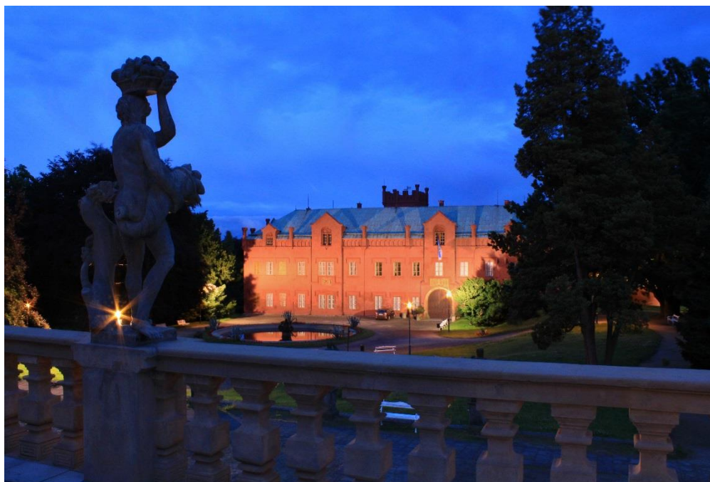
Obr. 17 Sochařská výzdoba Jana Brokofa a zámek Klášterec nad Ohří

Tato práce vznikla na základě mé vize zviditelnit mnohdy opomínané, ale velmi historicky cenné a zajímavé město Klášterec nad Ohří. Od mých dětských let jsem se začínal zajímat o fotografování, a právě na tomto místě jsem našel nové inspirace a nápady, které mi daly nový rozhled a od té doby se fotografování stalo součástí mého života. Proto jsem se rozhodl mou tvorbu zakomponovat do této práce a tím tak představit město Klášterec nad Ohří mými očima neboli jak ho vidím já. Pro mě osobně jsou architektura, příroda a fotografování velmi osobní téma, a proto jsem se i díky této práci rozhodl, že bych rád pokračoval v tomto směru i v mém studijním městě, a to v královském městě Kadaň, ve které hledám nové pohledy a inspirace. Myslím, že má práce by měla mít za úkol nejen město zviditelnit po kulturní stránce, ale také zaujmout čtenáře a přinést mu touto četbou například širší rozhled nebo chvíli odpočinku.