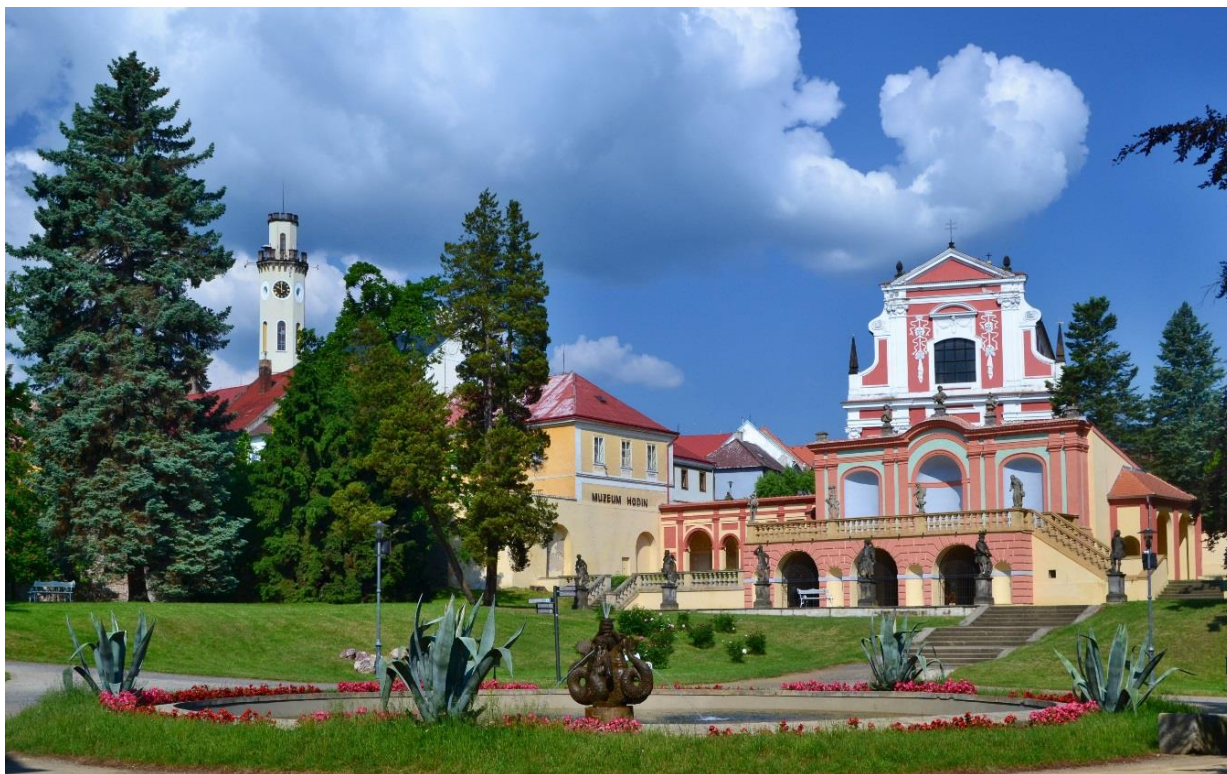
Obr. 9 Fotografie zachycující nádvoří zámku, na obrázku je vidět Sala terrena, Kostel Nejsvětější trojice a radniční věž

Sala terrena je jednopatrový letohrádek umístěný naproti kláštereckému zámku. Jedná se o barokní stavbu, kterou postavil italský stavitel Rossi de Lucca.