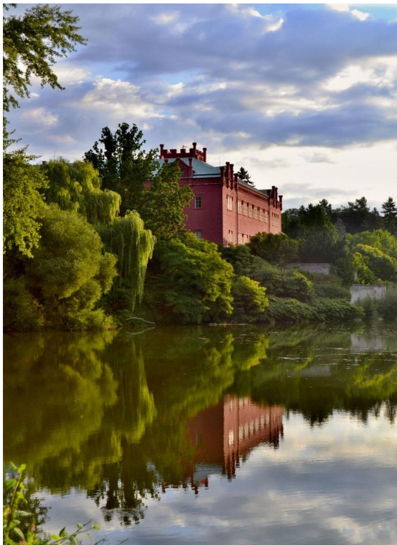
Obr. 3 Pohled na zámek z levého břehu řeky Ohře

Zámek je obklopen dendrologicky velmi cenným parkem v anglickém stylu z 19. století. Zámek s parkem je zakomponován v městské památkové zóně. Celá památková zóna je opravena a na návštěvníky působí velmi kladně.