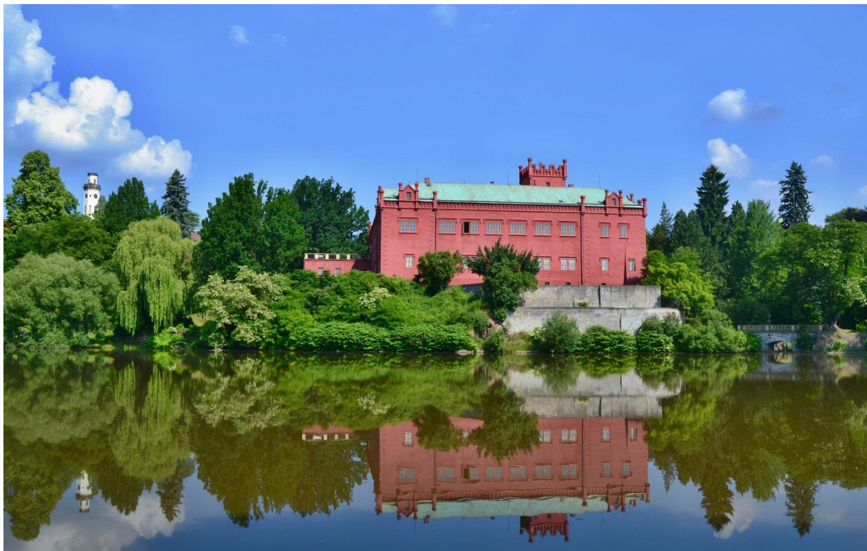
Obr. 4 Pohled na zámek a zámecký park

Návštěvnícké prohlídkové okruhy zámku jsou rozděleny do tří částí. První část prohlídkového okruhu tvoří muzeum porcelánu, druhým okruhem je pohádkový okruh a třetí okruh zahrnuje Atraktivitu. Lze také vyjít na zámeckou věž, která je součástí druhého a třetího prohlídkového okruhu. Jedním z nejnavštěvovanějších míst je také samotná Thunská hrobka. Zámek je zdobený také sochami umělce Jana Brokofa z 80. let 17. století.