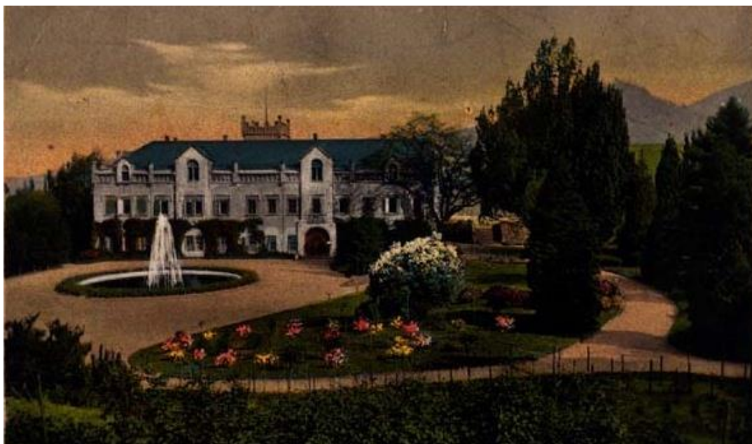
Obr. 2 Historická podoba zámku Klášterec nad Ohří

Roku 1277 král Přemysl Otakar II. zdejší probošství zrušil a jeho majetek přiřadil ke královské koruně. Osadu pak nakonec získali jako léno Šumburkové, kteří ji na začátku 14. století přiřadili k perštejnskému panství. Členové tohoto německého rodu přišli do Čech někdy v polovině 13. století a získali zde majetek i významné postavení. Někdy v první třetině 14. století získali do vlastnictví Perštejn, který se stal jejich rodovým hradem v Čechách.