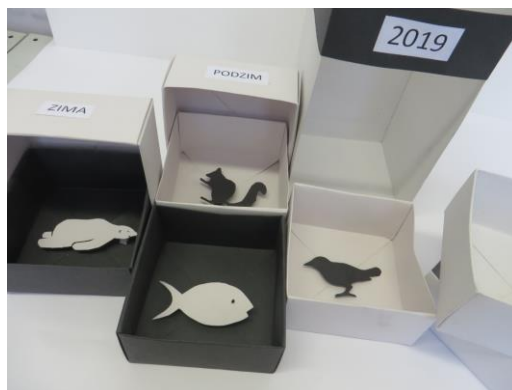
Obr. 6: Práce studentů 1. ročníku