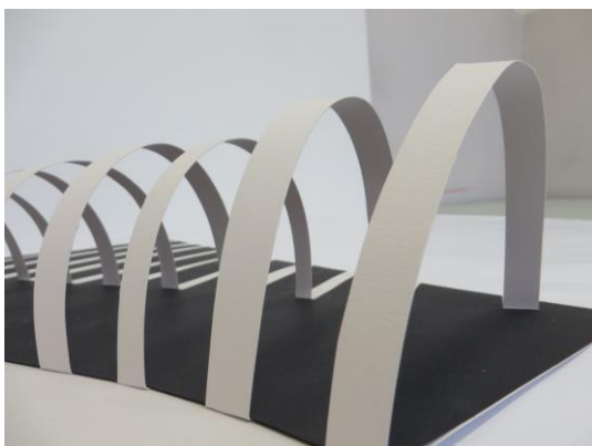
Obr.5: Práce studentů 1. ročníku