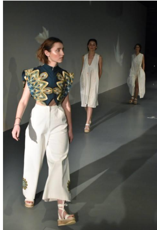
Obr. 8: Módní přehlídka maturantů – Vize 2019 v Camp – Centru architektury a městského plánování – budování nového snu o naší planetě