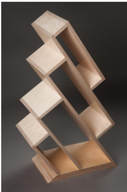
Obr.9. Práce studentů – úložný prostor ze dřeva